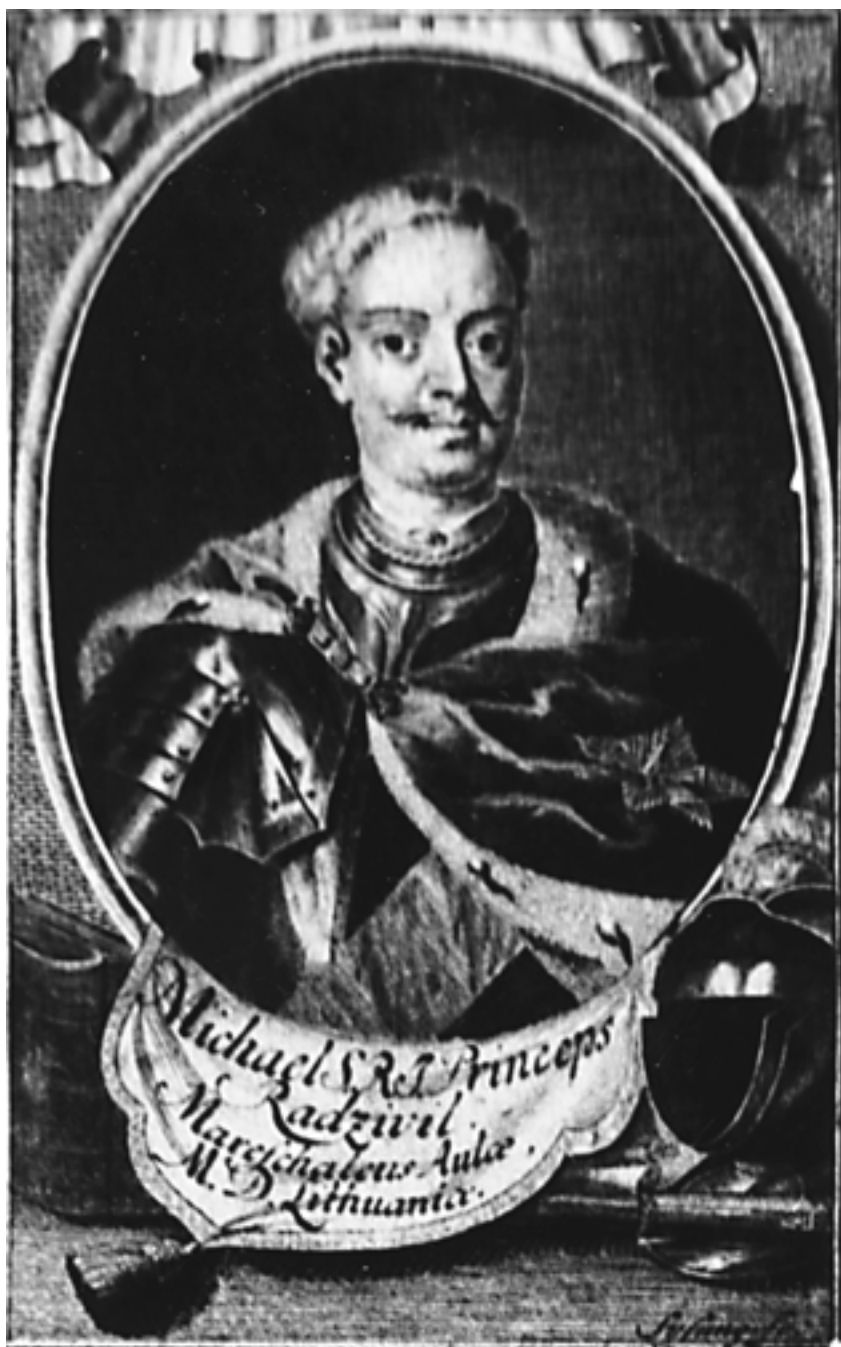
Michał Kazimierz „Rybeńko” (1702–1762)