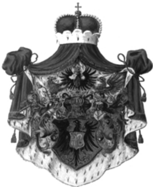
Herb z rodosłownej księgi z 1914 r.