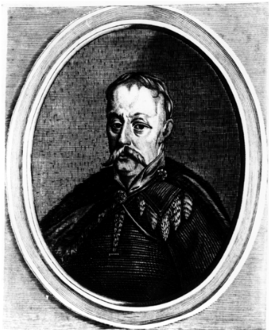
IANVSIO RADZIWIŁ DVCA DI BIRZA, E DVBBING PRINCEPE DEL SACRO ROMANO IMPERIO CAPITAN GENERALE DELL' ESERCITO DEL GRAN DVCATO DI LITVANIA &c.