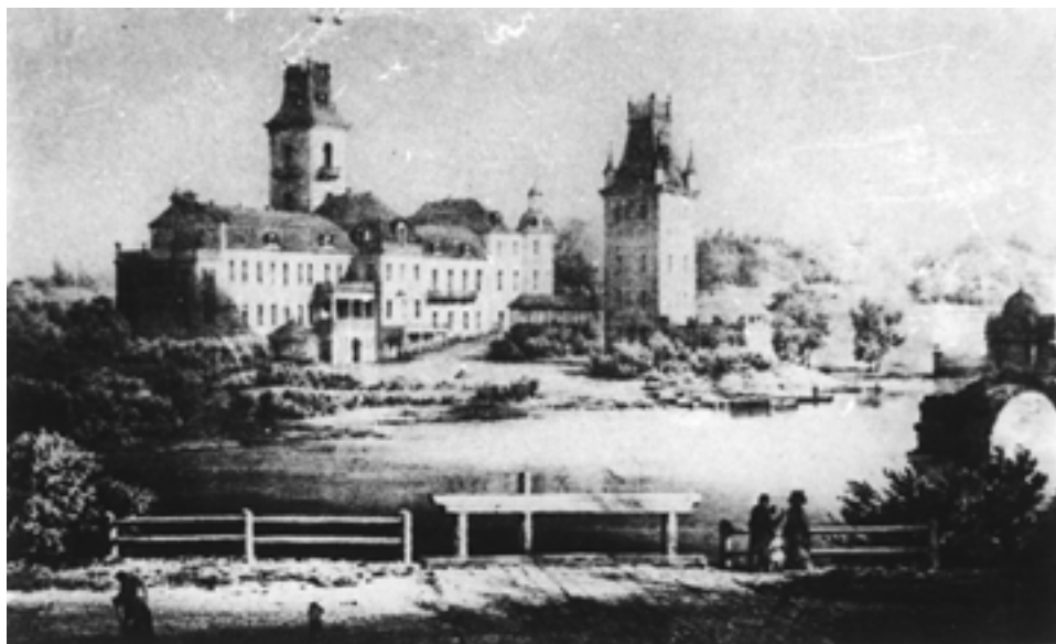
Zamek w Kiejdanach – widok (litografia N. Ordy)

m.in. stolarski produkujący meble w stylu chinoiserie , zegarmistrzowski, namiotniczy, produkcji wozów i kolasek. W nowo zakładanych manufakturach Radziwiłłowa budowała osady dla majstrów i pracowników, np. Niehniewicze, które były wzorcowym miasteczkiem wzniesionym od podstaw według specjalistycznego projektu architektonicznego. Starła się o wyszkolenie miejscowych artystów i rzemieślników, co podkreślała w umowach z cudzoziemcami–specjalistami i doprowadziła do sytuacji, że około 1770 r. w radziwiłłowskich hutach szklanych zatrudnieni byli już prawie wyłącznie mistrzowie miejscowi.