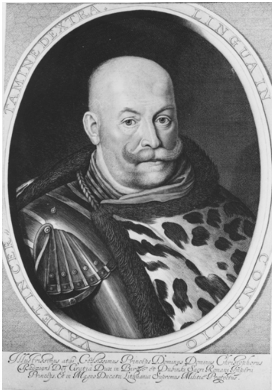
Krzysztof Radziwiłł (1547–1603) „Piorun”