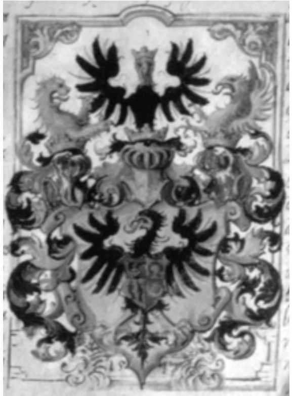
Herb z dyplomu z 1547 roku

dzenie wydane przez króla Ferdynanda I dla Mikołaja „Czarnego”, który od tego czasu tytułował się księciem na Ołyce, Nieświeżu Birzach i Dubinkach datowane jest 14 XII tegoż roku. Oryginał znajduje się również w zbiorach AGAD wśród dokumentów pergaminowych wraz z wymalowanym herbem 56 . Przedstawia on w polu złotym orła czarnego z rozpostartymi skrzydłami o otwartym dziobie i łapach złotych i języku czerwonym. Na piersi orła tarcza sercowa czwórdzielna w krzyż; w polu I błękitnym trzy trąby czarne o okuciach złotych złączone ustnikami 2, 1 (herb Trąby), w polu II