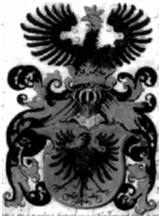
Herb z dyplomu z 1518 roku

do nadania tytułu księcia Rzeszy na Goniądzu i Medelach (Miadziole) 25 II 1518 r. Dokument nadający tytuł przechowywany jest do dziś w Archiwum Głównym Akt Dawnych w Warszawie 53 . Zygmunt I potwierdził tytuł Mikołaja tegoż 1518 roku 54 . Linia książąt goniądzkich wymarła już w następnym pokoleniu wraz ze śmiercią Mikołaja biskupa żmudzkiego. Herb — reprodukowany powyżej — przedstawia w polu złotym orła czarnego z tarczą sercową, w polu błękitnym trzy trąby złote 2, 1 złączone ustnikami w środku. Na tarczy hełm prętowy z koroną szlachecką złotą, w której połu-orzeł czarny z rozpostartymi